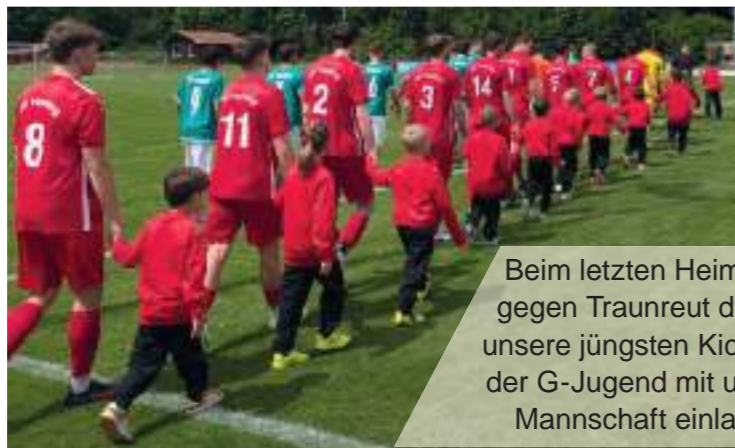
Beim letzten Heimspiel gegen Traunreut durften unsere jüngsten Kicker von der G-Jugend mit unserer Mannschaft einlaufen