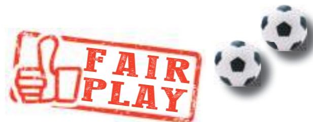
Die Trainer der F-Jugend

F2: Die F2 hatte es im Turnier mit sehr starken Gegnern zu tun. Jedoch stand hier auch wieder bei allen 4 Spielen der Spaß im Vordergrund. Die Mannschaft konnte den 4. Platz erreichen. In den nächsten Wochen bestreiten wir noch drei weitere Freundschaftsspiele sowie zwei Fußball Festivals, welche dann am 19.10.24. in Haiming mit dem eigenen Turnier enden. Ab Mitte November wechseln wir dann ins Hallentraining, wo sich die Kinder wieder über den „Budenzauber“ freuen dürfen.